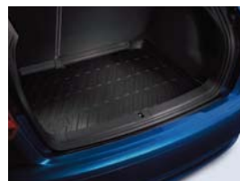
Tapis de coffre