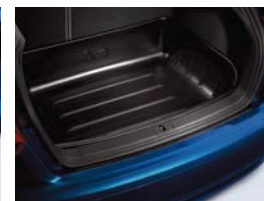
Cuve de coffre