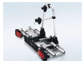
Porte-vélos (montage sur crochet)