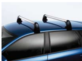
Barres de toit