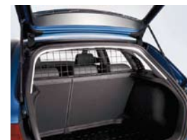
Grille de séparation