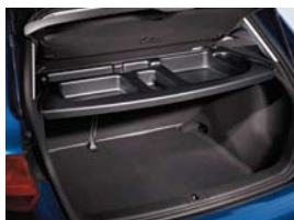
Bac de rangement

*Prix hors pose. Sous réserve de changement de référence ou de péremption. Vous rapprocher de votre magasin.