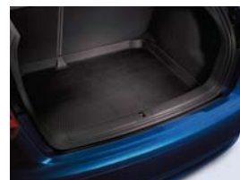
Insert de coffre