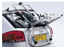
Porte-vélos (montage sur hayon)