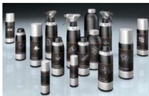
Une gamme complète de produits d'entretien Audi

L'ensemble de ces produits Audi peuvent être achetés à l'unité, renseignez-vous auprès de votre distributeur Audi.