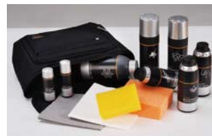
Coffret complet produits d'entretien Audi, réf. 4L0 096 353