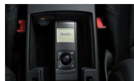
Adaptateur universel Audi