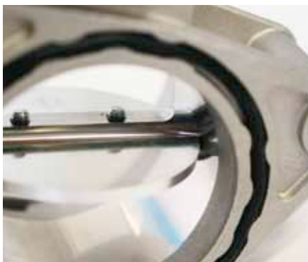
Papillon des gaz neuf