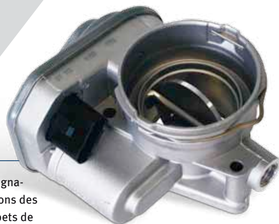
Vue du produit du papillon des gaz

Sous réserve de modifications et de variations dans les illustrations.