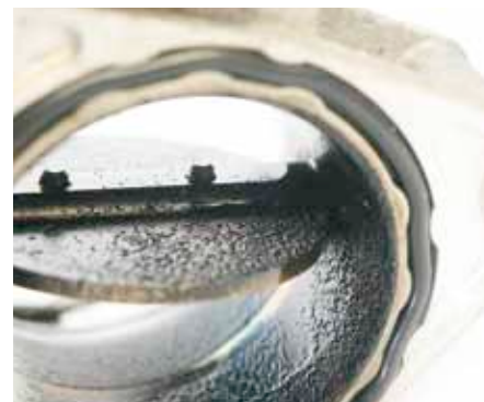
Papillon des gaz sali par l'huile