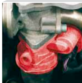
Le papillon des gaz vu de près (signalé en rouge)

A l'arrêt du moteur, le papillon des gaz est fermé en temps utile de façon à éviter que le moteur « secousse à l'arrêt ».